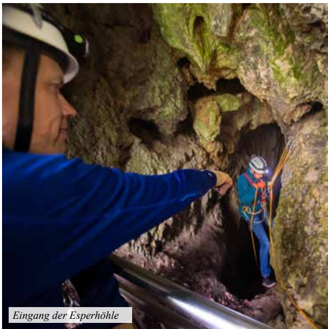
Eingang der Esperhöhle

Bei einer Brotzeit ließen wir den anstrengenden Tag ausklingen.