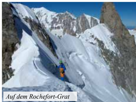
Auf dem Rochefort-Grat

schnell ist dieses Vergnügen mit dem Erreichen des Glacier de Leschaux zu Ende. Der Wiederaufstieg zur Hütte geht nach dem Erlebten wie von selbst.