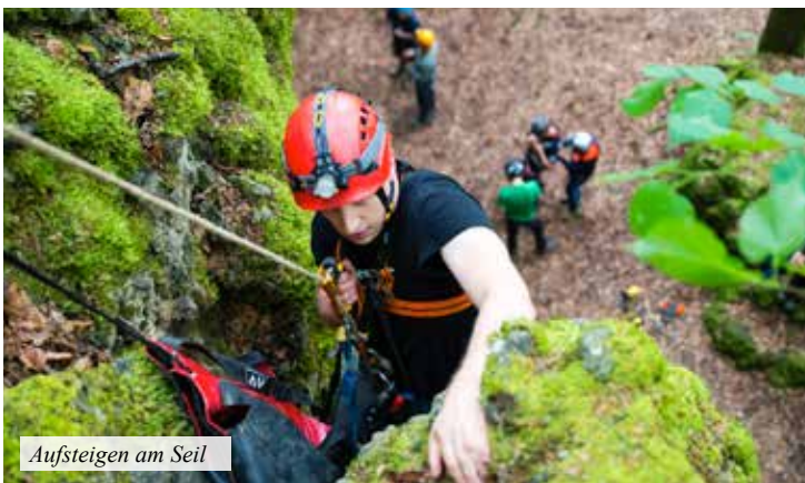
Aufsteigen am Seil

Auch andere Themen der Monatstreffen wurden während der Befahrungen vertieft. Und so wurde während unserer Touren über Höhlenentstehung und Speleotherme gefachsimpelt, wir machten viele Fotos und übten die Erstellung von Höhlenplänen.