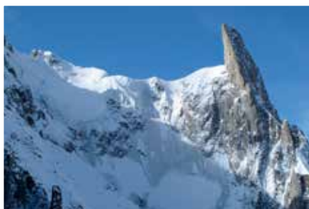
Rochefort-Grat und Dent du Geant von Norden