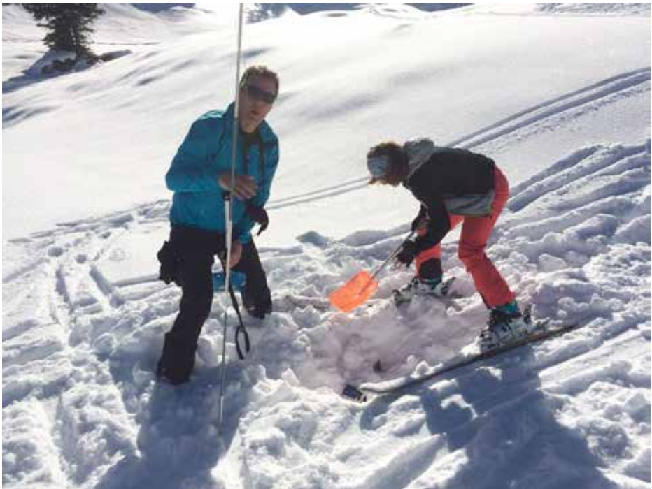
Suchübung mit LVS, Schaufel und Sonde