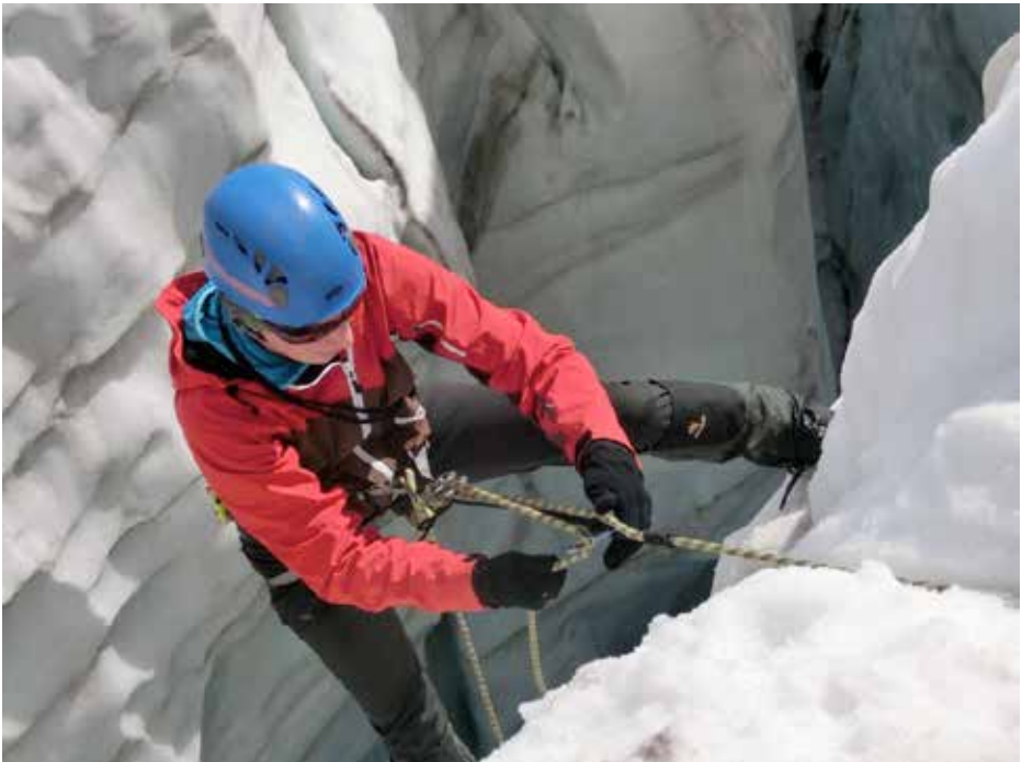
Spaltenbergung in der Praxis