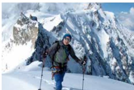
Auf den letzten Metern zur Aiguille du Plan

Die Magie wohlklingender Namen zieht uns wieder einmal in ihren Bann. Welcher Bergsteiger kommt bei Namen wie Mer de Glace, Refuge du Requin, Vallée Blanche und Dent du Geant nicht ins Träumen?