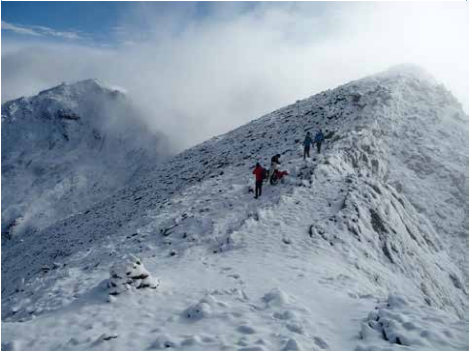
Winter im Sommer in der Schobergruppe