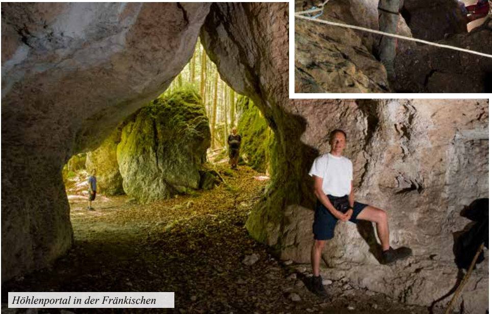
Höhlenportal in der Fränkischen