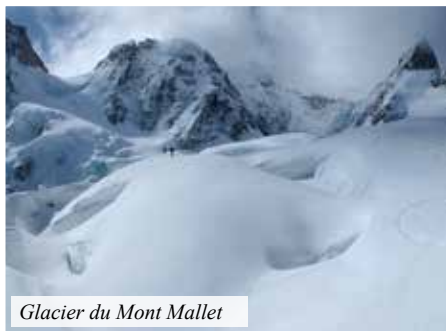
Glacier du Mont Mallet

So kommt es, dass wir in diesem Frühjahr gleich zweimal Chamonix als Ausgangspunkt für unsere Touren wählen.