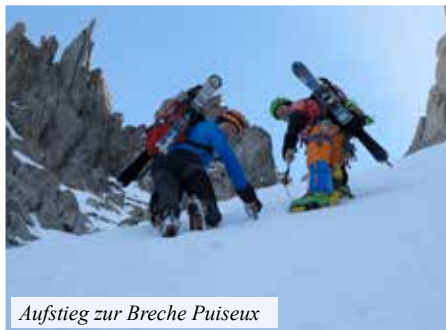
Aufstieg zur Breche Puiseux